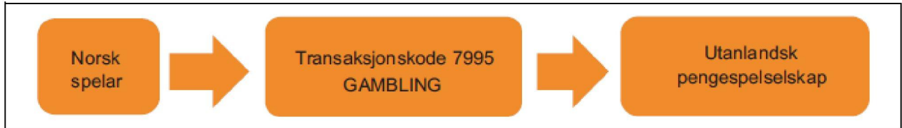
Figur 13.1 Betalingsformidling av bankkorttransaksjonar før betalingsformidlingsforbudet

Figurene under illustrerer hvordan transaksjonene ble gjennomført før og hvordan de blir gjennomført etter betalingsformidlingsforbudet (figurene 13.1 og 13.2 fra stortingsmeldingen):